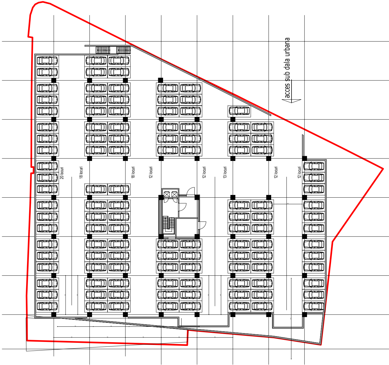
PARCARE SUB DALA URBANA =117 locuri PLAN DEMISOL SC.1:500